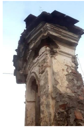
Tipica Edicola Votiva rupestre