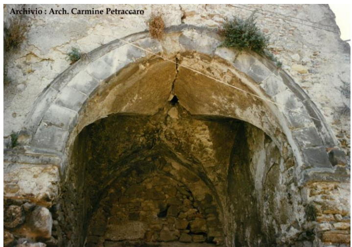
Pronao Cappella di S. Giacomo nei pressi della quale è stata edificata San Felice

L'escursione avrà inizio alle ore 09:00 e si articolerà in due tempi: il primo termina con la colazione a sacco alle ore 13:00, il secondo per continuare la passeggiata attraverso sentieri, campi e coltivazioni tipiche montoresi. Il Trek termina alle ore 16:00 alla Chiesa di San Felice.