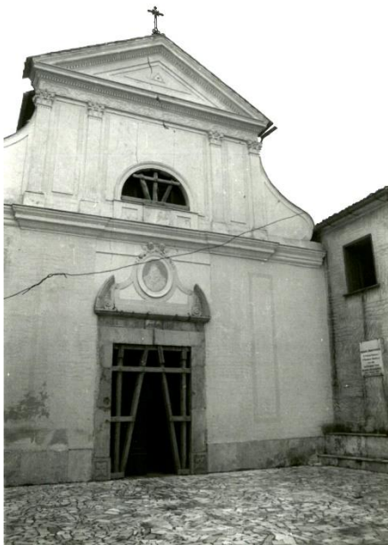
Chiesa di San Felice